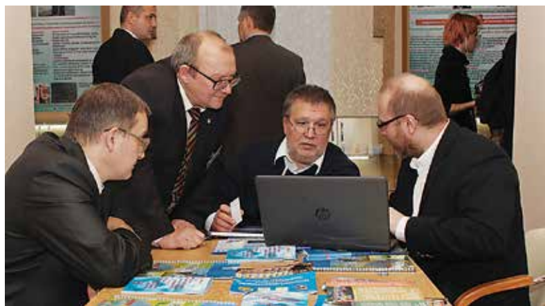
Участники форума «Нефтехимия-2018»