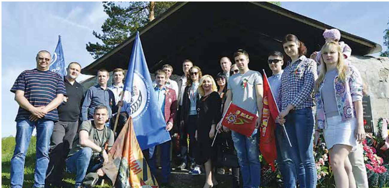
Молодежь «Полимира» на автопробеге